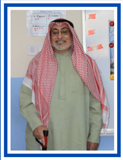
سعادة المرحوم الشيخ عيسى بن محمد آل خليفة طيب الله ثراه (مؤسس مدارس الفلاح)

مدارس الفلاح الخاصة هي احدى أهم المؤسسات التربوية في مملكة البحرين تأسست في عام 1990 م